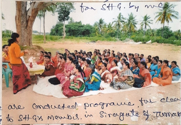
we are conducted programme for clean city to SHGs member. in Siraguda of Tumkur