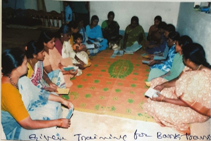
Given Training for Banks transactions for SHG. by me.